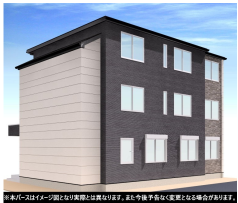
※本パースはイメージ図となり実際とは異なります。また今後予告なく変更となる場合があります。